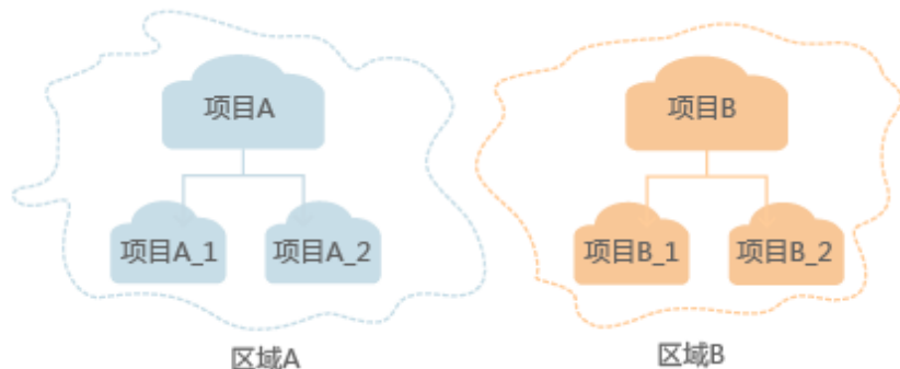
图 1-1 项目隔离模型

区域默认对应一个项目，这个项目由系统预置，用来隔离物理区域间的资源（计算资源、存储资源和网络资源），以默认项目为单位进行授权，用户可以访问您账号中该区域的所有资源。如果您希望进行更加精细的权限控制，可以在区域默认的项目中创建子项目，并在子项目中创建资源，然后以子项目为单位进行授权，使得用户仅能访问特定子项目中资源，使得资源的权限控制更加精确。